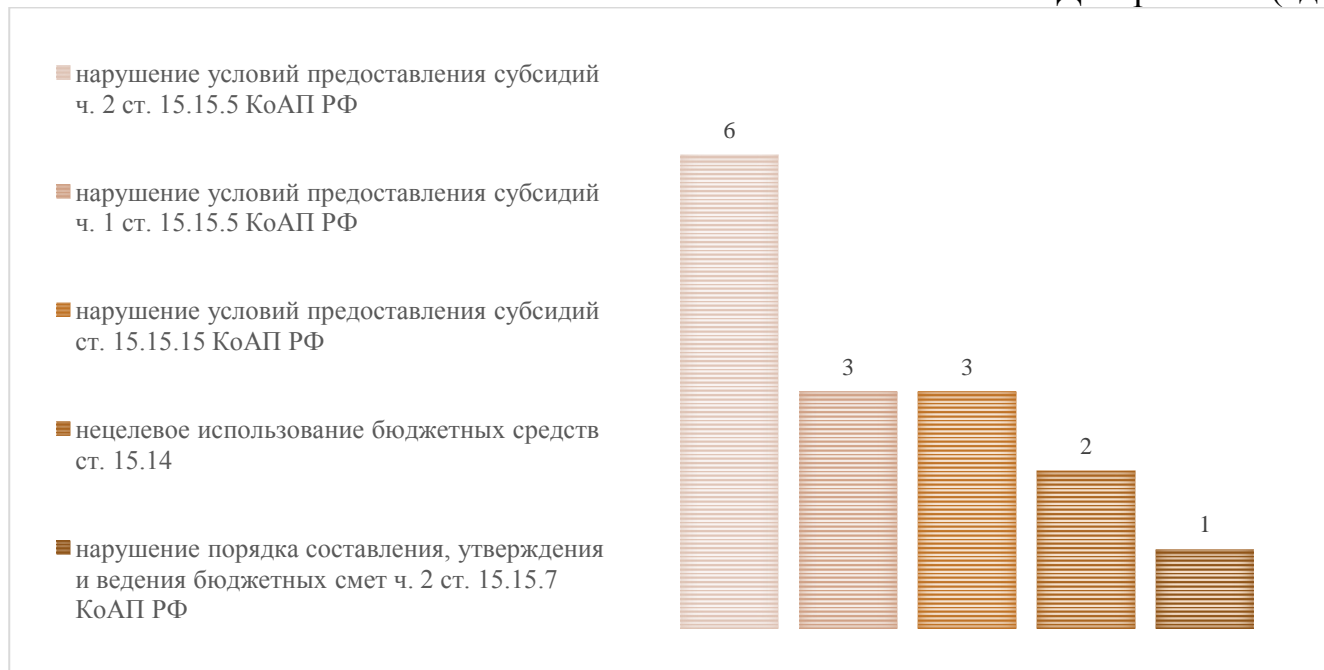
Диаграмма 2 (ед.)

Всего по результатам контрольной, экспертно-аналитической и экспертной деятельности подготовлено 13 актов и 30 заключений.